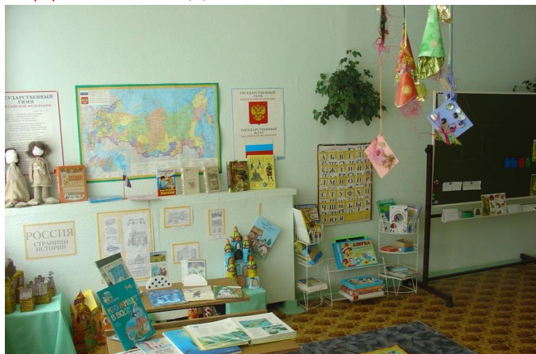
«Россия – Родина моя»