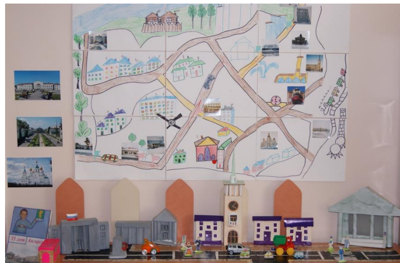
«Ангарск – любимый город!»