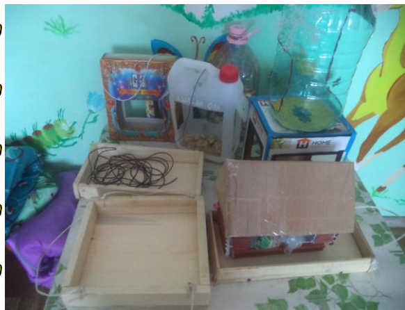
Аппликация «Снегири на ветке»