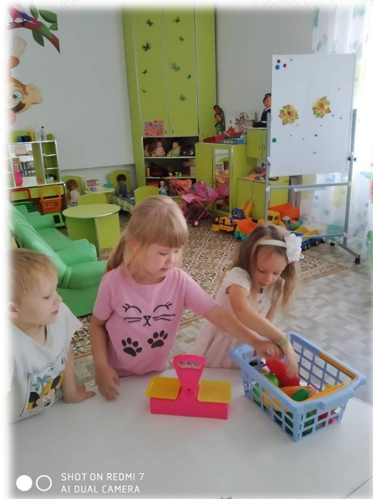
SHOT ON REDMI 7 AI DUAL CAMERA