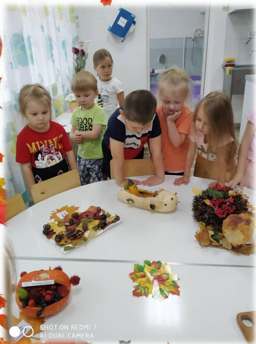
SHOT ON REDMI 7 AI DUAL CAMERA