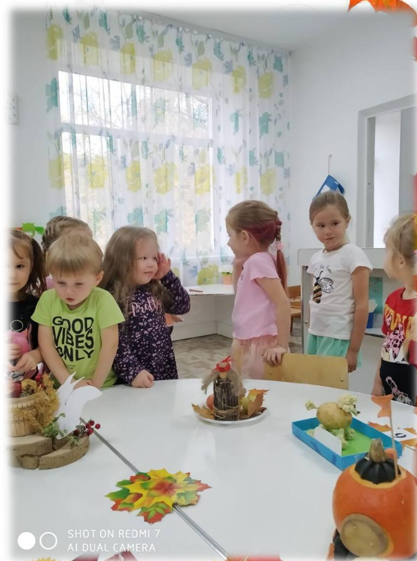
SHOT ON REDMI 7 AI DUAL CAMERA