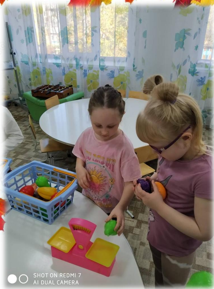
SHOT ON REDMI 7 AI DUAL CAMERA