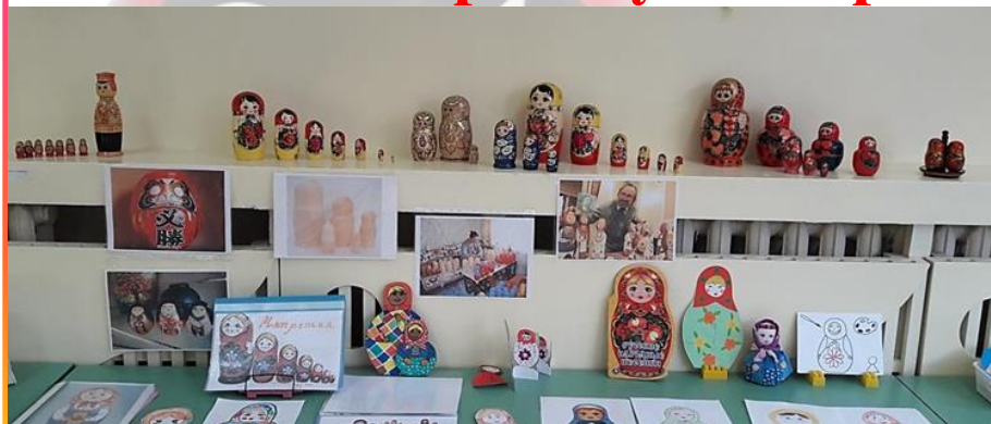
Минимусей «Матрёшка – русская краса»