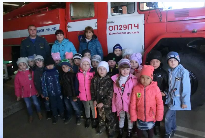
МДОБУ Детский сад «Василёк»