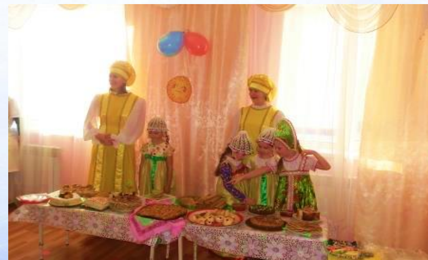
МДОБУ Детский сад «Василёк»