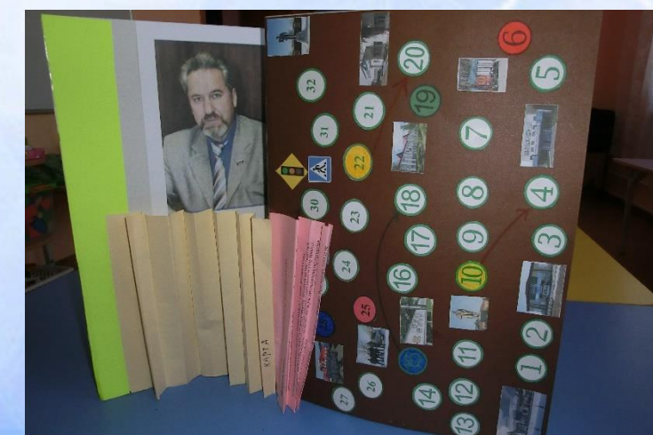
МДОБУ Детский сад «Василёк»