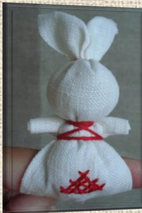
«ЗАЙЧИК НА ПАЛЬЧИК»